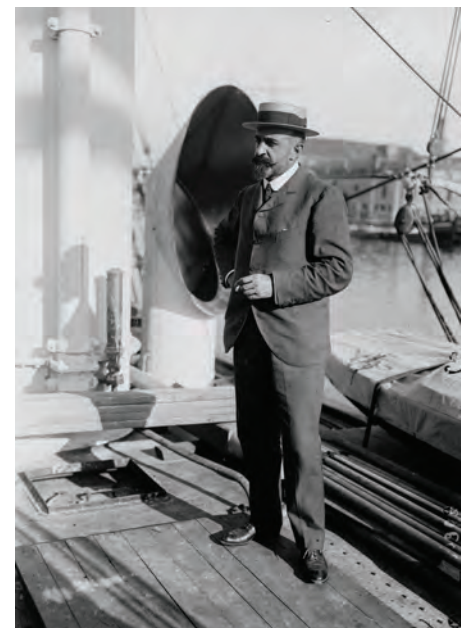
Départ de la mission Charcot pour le pôle Sud, sur le pont du Pourquoi-Pas ? . Le Havre (Seine-Maritime), 1908