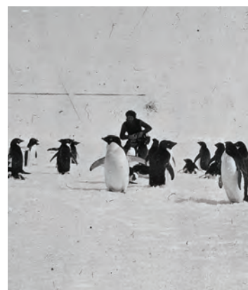
© Département des Hauts-de-Seine. Musée départemental Albert-Kahn. CHA23