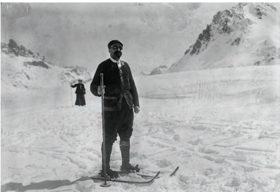
© Le commandant Charcot en 1908 © Maurice-Louis Branger - Roger-Viollet

Le 16 septembre 1936 au matin, après douze heures de tempête, le Pourquoi-Pas ? IV se brise sur les récifs de l'intérieur du Faxafjord, au large de l'Islande . Jean-Baptiste Charcot et tous ses compagnons, à l'exception d'un seul, y laissent leur vie.